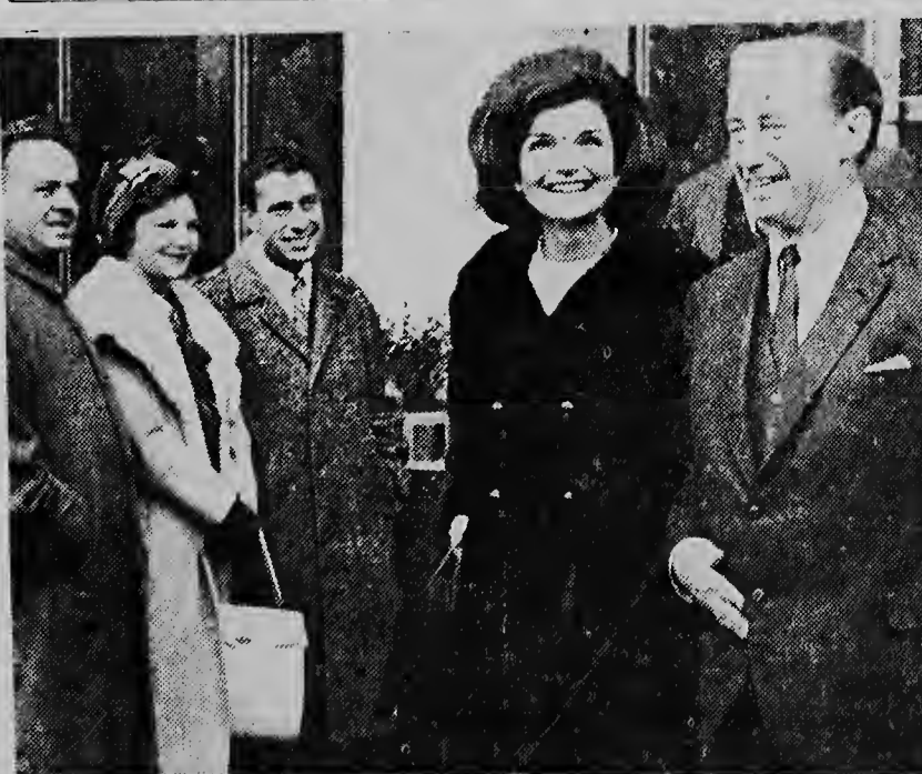
Jacqueline Kennedy tabata huesped di honor na e lunch, cual a tuma lugar na cuartel general di Naciones Unidas, aki nos ta mira Jackie na brazo di e representante Mericano den N.U., Adlai Stevenson.